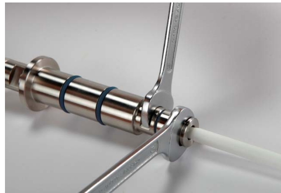
Abbildung 7: Anziehen der Überwurfmutter