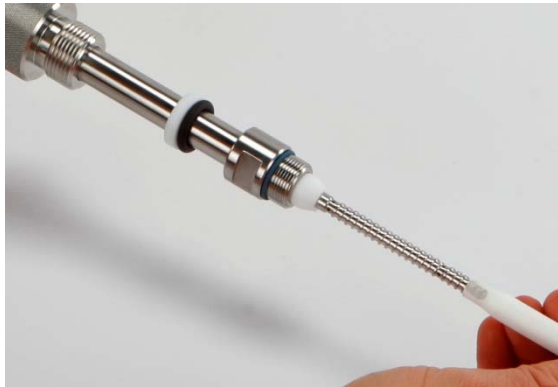
Abbildung 5: Aufstecken der Polypropylen Membran

Nun wird die Überwurfmutter bzw. des Membranschutzkäfigs vorsichtig über die aufgesteckte Membran geschoben und in die Filtrationseinheit geschraubt. Die Verschraubung wird unter Verwendung von 2 Maulschlüsseln bis zum mechanischen Anschlag angezogen (Abbildung 7).