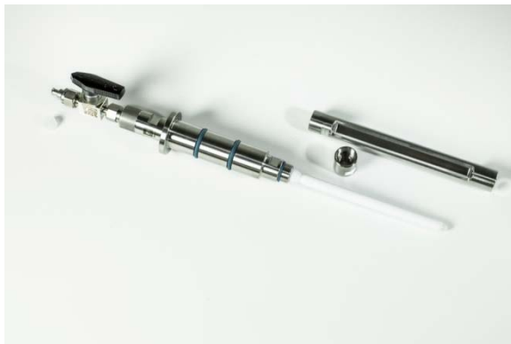
Abbildung 6: Aufgesteckte Polypropylen Membran

Nun wird die Überwurfmutter bzw. des Membranschutzkäfigs vorsichtig über die aufgesteckte Membran geschoben und in die Filtrationseinheit geschraubt. Die Verschraubung wird unter Verwendung von 2 Maulschlüsseln bis zum mechanischen Anschlag angezogen (Abbildung 7).