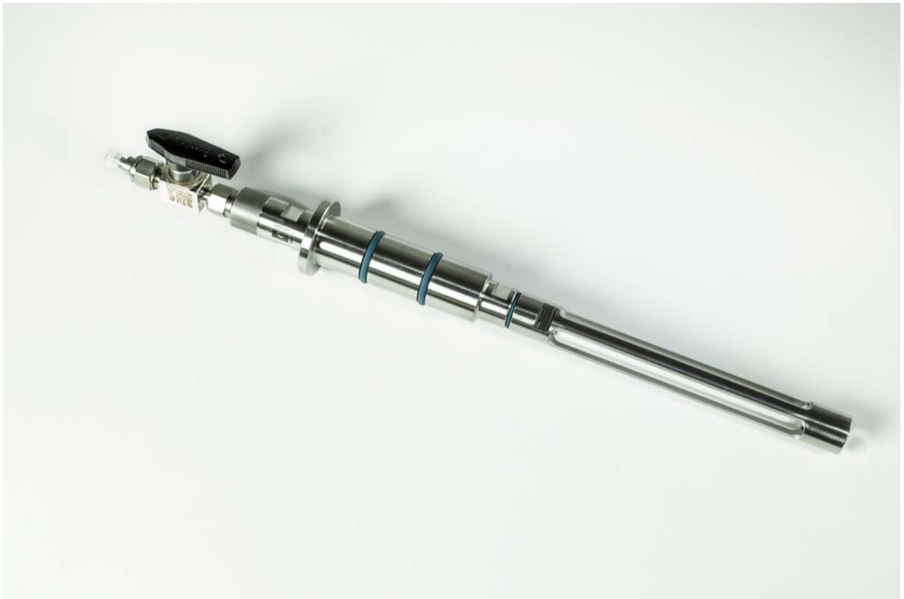
Abbildung 1: Filtrationssonde zum Einbau in einen 25 mm Seitenport mit Membranschutzkäfig