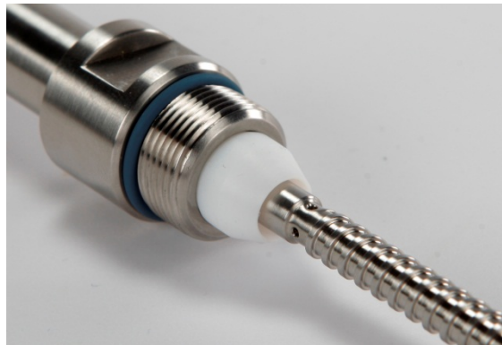
Abbildung 3 und 4: Einbau des PTFE Dichtkonus

Die Polypropylen Membran wird aus der Verpackung genommen und vorsichtig auf den Membranträger bis zum Anschlag in den bereits montierten PTFE Dichtkonus gesteckt.