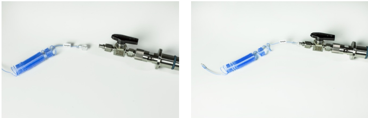
Abbildung 8 und 9: Anschluss der Filtrationssonde an das Schlauchset der online Analysegeräte TRACE C2 Control / BioPAT®Trace

Die Filtrationssonde wird direkt mit dem Filtrationsschlauchset der online Analysegeräte TRACE C2 Control und BioPAT®Trace verbunden (Abbildung 8 und 9).